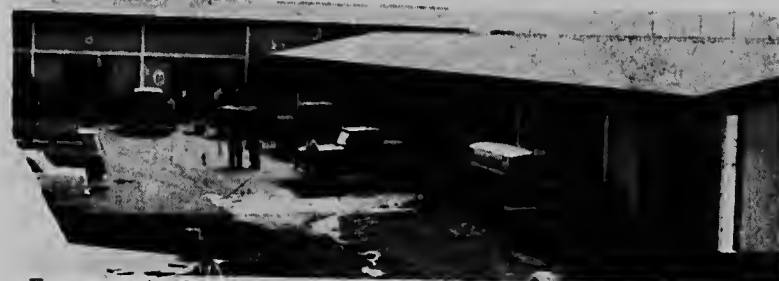
E compania di electricidad na Aruba "Elmar" diamars atardi a inaugura su edificio nobo den Wilhelminastraat na Oranjestad cu un recepcion bon concurrí. E foto aki ta muestra e taller espacioso di e compania aki den e edificio nobo.